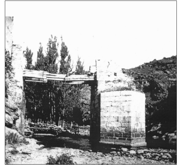
Puente de La Corcha